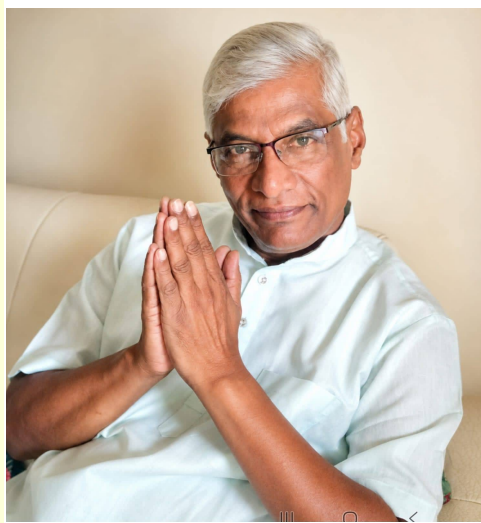
డిస్ట్రిబ్యూటర్ల ఆర్థిక స్థిరత్వం అవసరం: