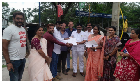
ప్రధాన చౌరస్తాలో రోజురోజుకూ ట్రాఫిక్ రద్దీ పెరిగిపోతుండటంతో ప్రజలు తీవ్ర ఇబ్బందులు ఎదుర్కొంటున్నారని తెలిపారు. ప్రమాదాలను నివారించి ప్రజల ప్రాణాలు, ఆస్తులను రక్షించేందుకు