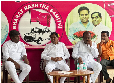
జలాలు తీవ్రంగా దెబ్బతింటాయని ఆందోళన వ్యక్తం చేశారు. ప్రజల అభిప్రాయాలను పరిగణనలోకి తీసుకోకుండా ప్రభుత్వం జీవో నం. 641ను జారీ చేయడం ప్రజావ్యతిరేక నిర్ణయమని విమర్శించారు. డంపింగ్ యార్డ్ జీవోను ప్రభుత్వం వెంటనే రద్దు చేయాలని డిమాండ్ చేస్తూ, జీవో 641

తొలి అక్షరం/షాద్ నగర్, జూలై 03: సిద్దాపూర్ గ్రామంలో జీహెచ్ఎస్సీ ఘన వ్యూహ నిర్వహణ కేంద్రం (డంపింగ్ యార్డ్) ఏర్పాటు కోసం ప్రభుత్వం జారీ చేసిన జీవో నం. 641పై భవిష్యత్ కార్యచరణను నిర్ణయించేందుకు ఈరోజు షాద్ నగర్లోని టిఆర్ఎస్ పార్టీ కార్యాలయంలో మాజీ ఎమ్మెల్యే అంజయ్య యాదవ్ ఆధ్వర్యంలో సిద్దాపూర్, పరిసర గ్రామాల నాయకులు, ప్రజాప్రతినిధులతో సమీక్షా సమావేశం నిర్వహించారు. ఈ సందర్భంగా మాజీ ఎమ్మెల్యే అంజయ్య యాదవ్ మాట్లాడుతూ, డంపింగ్ యార్డ్ ఏర్పాటుతో సిద్దాపూర్లో పాటు పరిసర గ్రామాల ప్రజల ఆరోగ్యం, పర్యావరణం, వ్యవసాయం, భూగర్భ