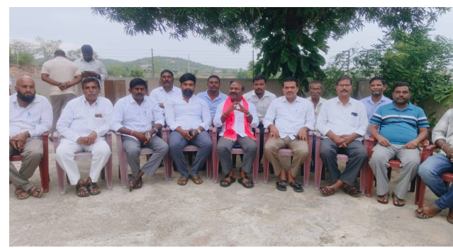
మంత్రి చెప్పింది నిజమా? అని ప్రశ్నించారు. ఈ అంశంపై మంత్రి జూపల్లి కృష్ణారావు చేసిన వ్యాఖ్యలను ప్రస్తావిస్తూ, తాను చేసిన సవాళ్ల నేపథ్యంలో రాజీనామా చేయాల్సింది ఎవరో ప్రజలకు స్పష్టం ఇవ్వాలని అన్నారు. అసెంబ్లీలో ప్రభుత్వం చేసిన ఆరోపణలకు తాము సమాధానం ఇచ్చామని, టిఆర్ఎస్ ప్రభుత్వం చేసిన అప్పు రూ. 4 లక్షల కోట్లైనా అధికారంలో నిరాపిందామని తెలిపారు. అలాగే, కాగ్ నివేదికలో కూడా టిఆర్ఎస్ ప్రభుత్వ

తొలి అక్షరం/రామన్నపేట జూలై 3: రామన్నపేట మండల కేంద్రంలో మాజీ శాసనసభ్యులు చిరుమర్తి లింగయ్య ఏర్పాటుచేసిన పత్రిక సమావేశంలో మాట్లాడుతూ 2023 డిసెంబర్ నుంచి 2026 జూన్ వరకు రాష్ట్ర ప్రభుత్వం ఎఫ్ఆర్పీఎం (ఘోడిపీ) కింద రూ. 1,86,087 కోట్ల అప్పు తీసుకువచ్చిందని అధికారిక లెక్కలు చెబుతున్నాయని, అయితే మంత్రి తనకు రాసిన లేఖలో మాత్రం రూ. 1,77,058 కోట్లుగా పేర్కొన్నారు అన్నారు. ఈ రెండు లెక్కల మధ్య ఉన్న దాదాపు రూ. 10 వేల కోట్ల వ్యత్యాసంపై ప్రభుత్వం సమాధానం చెప్పాలని డిమాండ్ చేశారు. అలాగే, 2026 మార్చి 18న అసెంబ్లీలో ముఖ్యమంత్రి రేవంత్ రెడ్డి మాట్లాడుతూ తమ ప్రభుత్వం 27 నెలల్లో రూ. 3,47,294 కోట్ల అప్పు చేసిందని ప్రకటించారని గుర్తు చేశారు. మరోవైపు మంత్రి జూపల్లి కృష్ణారావు వేరే లెక్కలు చెబుతున్నారని పేర్కొంటూ, ముఖ్యమంత్రి చెప్పింది నిజమా? లేక