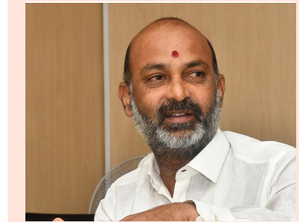
తొలి అక్షరం/హైదరాబాద్, జూలై 3: కాంగ్రెస్, భారాన నేతల నటన అద్భుతంగా ఉందని,