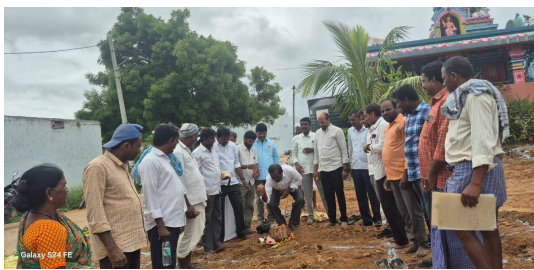
తొలి అక్షరం/షాద్ నగర్, జూలై 03: జిల్లేడు చౌదరిగూడ మండలంలోని పిర్జాపూర్ గ్రామంలో ఎన్ఆర్కెజిఎస్ (ఉపాధి హామీ) నిధులతో నిర్మించనున్న నూతన గ్రామపంచాయతీ భవనానికి శుక్రవారం ఘనంగా భూమిపూజ నిర్వహించారు. కాంగ్రెస్ మండల

ఎన్ఆర్కెజిఎస్ నిధులతో గ్రామాభివృద్ధికి శ్రీకారం ఎన్. చంద్రశేఖర్