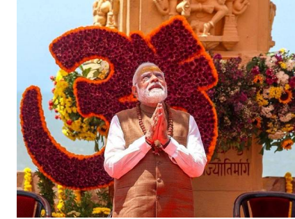
తొలి అక్షరం/హైదరాబాద్, జూలై 3: అమర్ నాథ్ యాత్రను పురస్కరించుకుని ప్రధాని నరేంద్ర