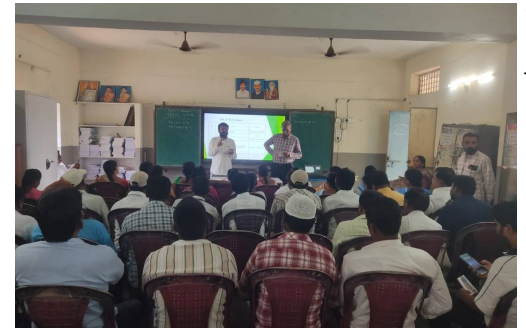
తొలి అక్షరం/నెక్కొండ జూన్ 19: వరంగల్ జిల్లా నెక్కొండ మండల కేంద్రంలోని జిల్లా పరిషత్ సెకండరీ స్కూల్ నెక్కొండలో భారత ఎన్నికల సంఘం అర్బులైన పౌరులను ఓటర్ జాబితాలో చేర్చి అనర్హులు జాబితాలో లేకుండా ఉండేందుకు జూన్ 25/ 2026 నుండి స్పెషల్ ఇంటెన్సివ్ లివిజన్ సర్ నిర్వహిస్తుంది,ఎన్యూమరేషన్ ఫారం జూన్ 25 నుండి జూలై 24 2026 వరకు బిఎల్ఎల్ ఇంటింటికి వెళ్లి ఎన్యూమరేషన్ ఫారం ను పంపిణీ చేస్తారు. ఓటర్లకు సంబంధించిన వివరాలను నింపుటకు సహాయం చేసే ఎన్యూమరేషన్ ను తీసుకుంటారు. ఫారంలో మీ పూర్వ ఫోటో, ప్రస్తుతం ఫోటో జత చేసి వున్న తేదీ ఆధార