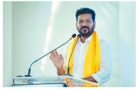
తొలి అక్షరం/హైదరాబాద్,జూన్ 10: ప్యూచర్ సిటీని రద్దు చేస్తామని కొందరు