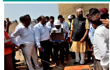
తొలి అక్షరం/మెడిగడ్డ,జూన్ 10: మెడిగడ్డ బ్యారేజీతో పాటు కాళేశ్వరం ప్రాజెక్టులోని