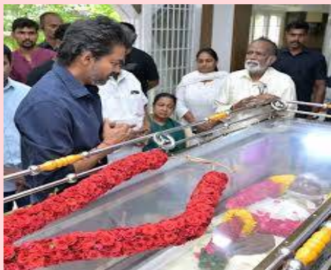
హామీ ఇచ్చారు. ఈ నిర్ణయం పట్ల నిర్మాతల సంఘం హర్షం వ్యక్తం చేసింది. ఈ సందర్భంగా టీఎఫ్ఏపీఏ ఒక పత్రికా ప్రకటన విడుదల చేసింది. భారతీయ చలనచిత్ర రంగంలో విప్లవాత్మక మార్పులు తీసుకొచ్చిన దార్శనికుడు

దిగ్గజ చలనచిత్ర దర్శకుడు భారతీరాజు అంత్యక్రియలను ప్రభుత్వ అధికారిక లాంఛనాలతో నిర్వహించనున్నట్లు తమిళనాడు ముఖ్యమంత్రి సి. జోసెఫ్ విజయ్ ప్రకటించారు. తమిళ చిత్ర పరిశ్రమకు ఆయన అందించిన అసమాన సేవలకు, ఆయన స్థాయికి గుర్తింపుగా ఈ నిర్ణయం తీసుకున్నట్లు ప్రభుత్వం వెల్లడించింది. భారతీరాజుకు అధికారిక లాంఛనాలతో తుది వీడ్కోలు పలకాలంటూ తమిళ ఫిల్మ్ యాక్టివ్ ప్రొడ్యూసర్స్ అసోసియేషన్ (టీఎఫ్ఏపీఏ) చేసిన విజ్ఞప్తికి ప్రభుత్వం సానుకూలంగా స్పందించింది. అంతకుముందు టీఎఫ్ఏపీఏ ముఖ్యమంత్రికి ఒక విజ్ఞప్తి చేస్తూ, తమ వ్యవస్థాపకుడైన భారతీరాజుకు ప్రభుత్వ గౌరవం కల్పించాలని కోరింది. దీనిపై వెంటనే స్పందించిన సీఎం విజయ్, ప్రభుత్వ గౌరవ వందనతో ఆయన అంత్యక్రియలు జరుగుతాయని