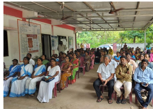
కార్యక్రమంలో తమ గుర్తింపు పొందిన 12 కార్డులలో ఏదో ఒకటి బిఎల్ఓ లకు అందించి ఓటరు జాబితాలో సరి చేసుకోవాలని తెలుపినది. జనాభా లెక్కల