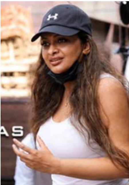
అంటూ చిత్ర బృందం ఒక సందేశాన్ని జోడించింది. ఈ వీడియో కేవలం మేకింగ్ విజువల్స్ మాత్రమే కాకుండా సినిమా ఎంత భారీ స్థాయిలో నిర్మాణం

కేజీఎఫ్ స్టార్ యన్ హీరోగా నటిస్తున్న మోస్ట్ అవైటెడ్ పాన్-ఇండియా చిత్రం 'టాక్సిక్'. ఈ సినిమాపై ప్రేక్షకుల్లో భారీ అంచనాలు నెలకొని ఉన్నాయి. తాజాగా ఈ చిత్ర దర్శకురాలు గీతా మోహన్ దాస్ పుట్టినరోజు సందర్భంగా చిత్ర యూనిట్ ఒక ప్రత్యేకమైన బిహైం ది-ది-సీన్స్ (బీటీఎస్) వీడియోను విడుదల చేసి అభిమానులకు సర్ప్రైజ్ ఇచ్చింది. ఈ వీడియో ప్రస్తుతం సోషల్ మీడియాలో వైరల్ అవుతోంది. ఈ బీటీఎస్ వీడియోలో దర్శకురాలు గీతా మోహన్ దాస్ తనదైన శైలిలో చిత్రాన్ని ఎలా తెరకెక్కిస్తున్నారో చూపించారు. భారీ యాక్షన్ సన్నివేశాలను చిత్రీకరిస్తున్నప్పుడు ఆమె కమాండింగ్ ప్రెజెన్స్, నటీనటుల నుంచి సటను రాబట్టుకుంటున్న తీరుతో పాటు భారీ సిబ్బందిని ఎంతో నమ్మకంతో, కచ్చితత్వంతో నడిపిస్తున్న విధానం ఆకట్టుకుంటోంది. ఈ వీడియోతో పాటు, "ప్రతి పాత్ర ప్రత్యేకంగా ఉండటం వెనుక, సంభాషణల కన్నా మౌనమే ఎక్కువ చెప్పడం వెనుక ఆమె ఉన్నారు! హ్యాపీ బర్త్ డే గీతా మోహన్ దాస్"