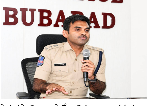
సామరస్యన్ని కాపాడే విధంగా అప్రమత్తంగా ఉంచాలని, సోషల్ మీడియాలో తప్పుడు ప్రచారాలు, వదంతులు వ్యాప్తి చెందకుండా కఠిన నిఘా ఉంచాలని ఆదేశించారు. ప్రజలు కూడా బాధ్యతాయుతంగా వ్యవహరించి అసత్య సమాచారాన్ని సమృద్ధిని సూచించారు. రోడ్డు ప్రమాదాల నివారణకు ప్రత్యేక అవగాహన కార్యక్రమాలు నిర్వహించాలని, ప్రజల్లో ట్రాఫిక్ నిబంధనలపై చైతన్యం కల్పించాలని తెలిపారు. ప్రజలను సరైన మార్గంలో నడిపించే బాధ్యత పోలీసులపై ఉందని, ప్రతి పోలీస్ అధికారి ప్రజలకు ఆదర్శంగా ఉండే విధంగా విధులు నిర్వహించాలని ఎస్పీ సూచించారు. జిల్లాలో ప్రజల విశ్వాసాన్ని మరింత పెంచే విధంగా క్రమశిక్షణ, బాధ్యతతో పని చేయాలని అధికారులకు దిశానిర్దేశం చేశారు.