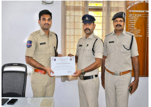
వ్యవసాయ శాఖ అధికారులతో సమన్వయం చేసుకుని తనిఖీలు నిర్వహించాలని ఆదేశించారు. రాత్రి పూట పట్టణమైన నైట్ పట్టణం నిర్వహించాలని, ప్రతి పట్టణం అధికారి తప్పనిసరిగా పాయింట్ బుక్స్ ను సక్రమంగా నిర్వహించాలని సూచించారు. పట్టణంలో విధుల్లో నిర్లక్ష్యం సహించబోమని హెచ్చరించారు. పెండింగ్ కేసులు, అండర్ ఇన్వెస్టిగేషన్ కేసులపై అధికారులను ప్రశ్నించి వివరాలు తెలుసుకున్నారు. కేసుల దర్యాప్తు వేగవంతంగా పూర్తి చేసే నేరస్తులపై చట్టపరమైన చర్యలు తీసుకోవాలని ఆదేశించారు. రాజోయ్ బ్రదర్స్ పండుగ సందర్భంగా జిల్లాలో శాంతియుత వాతావరణం నెలకొనేలా ప్రత్యేక చర్యలు చేపట్టాలని అధికారులకు సూచించారు. మత

తొలి అక్షరం/పన్నూర్ మే 22: మాదక ద్రవ్యాల రవాణా పై ప్రత్యేక నిఘా ఉంచాలని జిల్లా ఎస్పీ డాక్టర్ శబరిష్ అధికారులను ఆదేశించారు. శుక్రవారం పట్టణ పోలీస్ స్టేషన్ కాన్స్టేబుల్ హోల్లో జిల్లా ఎస్పీ డా.శబరిష్, జిల్లా పరిధిలోని పోలీస్ అధికారులతో నేర సమీక్షా సమావేశాన్ని నిర్వహించారు. జిల్లాలో శాంతి భద్రతల పరిరక్షణ, నేరాల నియంత్రణ, ప్రజా భద్రత అంశాలపై సమీక్ష నిర్వహించారు. ఈ సందర్భంగా ఎస్పీ డా. శబరిష్ మాట్లాడుతూ జిల్లాలో గంజాయి, మాదక ద్రవ్యాల నివారణకు ప్రత్యేక చర్యలు తీసుకోవాలని అధికారులను ఆదేశించారు. గంజాయి విక్రయాలు, రవాణా, వినియోగంపై కఠిన నిఘా కొనసాగించాలని సూచించారు. హోటళ్లు, లాడ్జలు, అనుమానాస్పద ప్రాంతాల్లో తరచూ తనిఖీలు నిర్వహించాలని తెలిపారు. నకిలీ విత్తనాలు (రాజుబత్తిఅశిబం రావనం), నకిలీ ఎరువులు విక్రయాలపై ప్రత్యేక దృష్టి పెట్టాలని అధికారులకు సూచించారు. రైతులను మోసం చేసే వారిపై కఠిన చర్యలు తీసుకోవాలని, వ్యవసాయ శాఖ అధికారులతో సమన్వయం చేసుకుని తనిఖీలు నిర్వహించాలని ఆదేశించారు. రాత్రి పూట పట్టణమైన నైట్ పట్టణం నిర్వహించాలని, ప్రతి పట్టణం అధికారి తప్పనిసరిగా పాయింట్ బుక్స్ ను సక్రమంగా నిర్వహించాలని సూచించారు. పట్టణంలో విధుల్లో నిర్లక్ష్యం సహించబోమని హెచ్చరించారు. పెండింగ్ కేసులు, అండర్ ఇన్వెస్టిగేషన్ కేసులపై అధికారులను ప్రశ్నించి వివరాలు తెలుసుకున్నారు. కేసుల దర్యాప్తు వేగవంతంగా పూర్తి చేసే నేరస్తులపై చట్టపరమైన చర్యలు తీసుకోవాలని ఆదేశించారు. రాజోయ్ బ్రదర్స్ పండుగ సందర్భంగా జిల్లాలో శాంతియుత వాతావరణం నెలకొనేలా ప్రత్యేక చర్యలు చేపట్టాలని అధికారులకు సూచించారు. మత