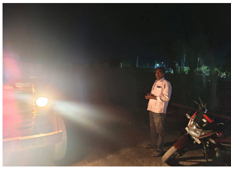
తొలి అక్షరం/మహబూబాబాద్ జ్యూరో మే 18: