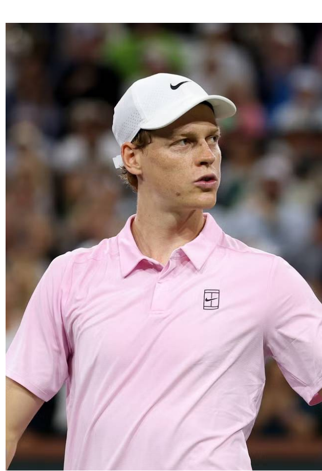
సిన్ ప్రస్తుతం అద్భుతమైన ఫామ్ లో ఉన్నాడు. వరుసగా తన 29వ మ్యాచ్ గెలిచాడు. దీంతో ఈ ఇటాలియన్ జోడి గెలుపుకోసం ఇదే మొదటిసారి.

ఇటలీ టెన్నిస్ స్టార్ జుజు సిన్ సరికొత్త చరిత్ర సృష్టించాడు. ప్రతిష్టాత్మక ఇటాలియన్ ఓపెన్ టైటిల్ ను కైవసం చేసుకున్నాడు. ఈ టోర్నీలో తాజాగా జరిగిన పైసల్ లో ప్రపంచ నంబర్ వన్ సిన్, నార్వేకు చెందిన కాస్పర్ రూడ్ ను 6-4, 6-4 తేడాతో వరుస సెట్లలో ఓడించాడు. దీంతో గత 50 ఏళ్లలో ఇటాలియన్ ఓపెన్ గెలిచిన తొలి ఇటలీ పురుష ఆటగాడిగా సిన్ రికార్డు కొట్టాడు. చివరిసారిగా 1976లో ఇటలీ ఆటగాడు అడ్రియానో పాస్సెరి ఈ టైటిల్ ను కైవసం చేసుకున్నాడు. ఇక టైటిల్ గెలిచిన అనంతరం సిన్ స్టర్ మాట్లాడుతూ "ఈ ట్రోఫీ 50 ఏళ్ల తర్వాత ఇటలీకి తిరిగి వచ్చింది. ఇది నాకు, యావత్ దేశానికి ఎంతో ప్రత్యేకమైన క్షణం" అని వ్యాఖ్యానించాడు. రెండుసార్లు ఫ్రాంస్ ఓపెన్ పైసల్ టెన్నిస్ గా నిలిచిన కాస్పర్ ఈ పైసల్ లో సిన్ కు గట్టి సవాల్ విసిరాడు. మ్యాచ్ లో అద్భుతమైన ఆరంభం చేసి, తొలుత ఆధిక్యం సాధించాడు. అయితే కరెక్ట్ టైమ్ లో సిన్ ర్ కమ్ బ్యాక్ ఇచ్చాడు. మ్యాచ్ పై పూర్తి నియంత్రణ సాధిస్తూ, వీడ్ లోకి దూసుకెళ్లాడు. అదే ఆధిక్యం కొనసాగిస్తూ మ్యాచ్ లో విజేతగా నిలిచాడు. అయితే మ్యాచ్ అనంతరం రూడ్ మాట్లాడుతూ "ఈ ఏడాది నువ్వు సాధిస్తున్న విజయాలను వర్తించడం కష్టం. చరిత్ర సృష్టించినందుకు అభినందనలు" అని సిన్ కు శుభాకాంక్షలు తెలిపాడు. కాగా, కాస్పర్ రూడ్ పై సిన్ 5-0 'పాడ్-టు-పాడ్' రికార్డుతో వీడ్ లో ఉన్నాడు.