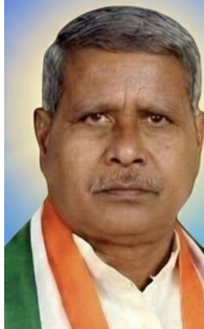
తొలి అక్షరం/రామన్నపేట మే 18: