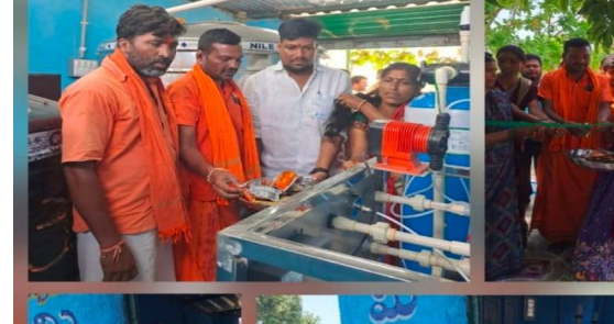
తొలి అక్షరం/నెక్కొండ మే 1: