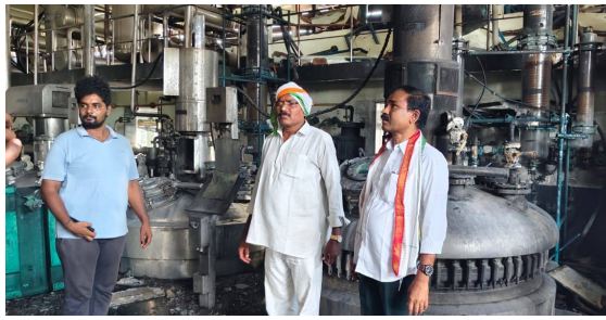
తొలి అక్షరం/రామన్నపేట మే 1:

నల్గొండ జిల్లా చిట్టాల మండలం పట్టణంలోని లిన్స్ ఫ్యాక్టరీలో రియాక్టర్ పేలిన ఘటనలో 9 మంది కార్మికులు గాయపడ్డారు వారిలో కొందరి పరిస్థితి విషమంగా ఉందని తెలిసింది ఈ ఘటన తెలిసిన వెంటనే తిలలంగాణ రాష్ట్ర