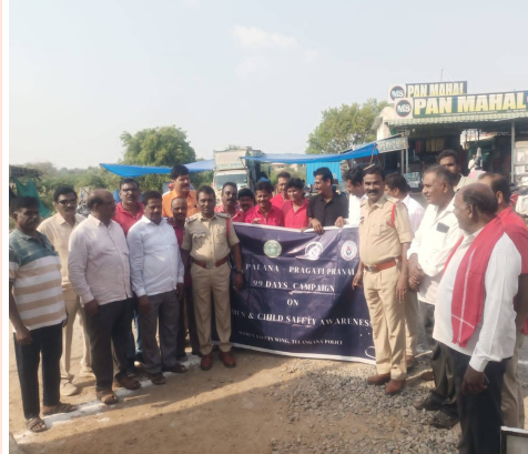
పోలీసులకు సహకరించాలని ఆయన కోరారు. ఈ కార్యక్రమంలో భరోసా కేంద్రం నుండి అంబికా, షి

తొలి అక్షరం/రాష్ట్ర ప్రతినిధి (పి. సైదులు), మే 1: మహిళల భద్రత, రక్షణపై అవగాహన కల్పించేందుకు రాష్ట్ర మహిళా భద్రత విభాగం ఆదేశాల మేరకు చుంచుపల్లి మండలంలో ప్రత్యేక కార్యక్రమాలు నిర్వహించారు. ప్రజా పాలన - ప్రగతి ప్రణాళికలో భాగంగా షీ టీమ్స్ ఎవెన్చియూ బృందాలు సంయుక్తంగా చుంచుపల్లి గ్రామ పంచాయతీ కార్యాలయం, బైపాస్ రోడ్డు ఏరియాల్లో అవగాహన సదస్సులు నిర్వహించాయి. ఈ సందర్భంగా షీ టీమ్స్ ఎస్సె లక్ష్యం మాట్లాడుతూ.. సమాజంలో మహిళలపై జరుగుతున్న హింసను నివారించడంలో స్థానిక నాయకత్వం, ప్రజల బాధ్యత ఎంతో ఉండవలసింది. బాధితులకు అండగా ఉండేందుకు ప్రభుత్వం ఏర్పాటు చేసిన 'స్పందన' వంటి వ్యవస్థలను ఏలా బలోపేతం చేయాలి వివరించారు. ఎవరైనా వేధింపులకు గురైతే వెంటనే ఫిర్యాదు చేయాలని నేరాల నివారణలో స్థానిక ప్రజాప్రతినిధులు