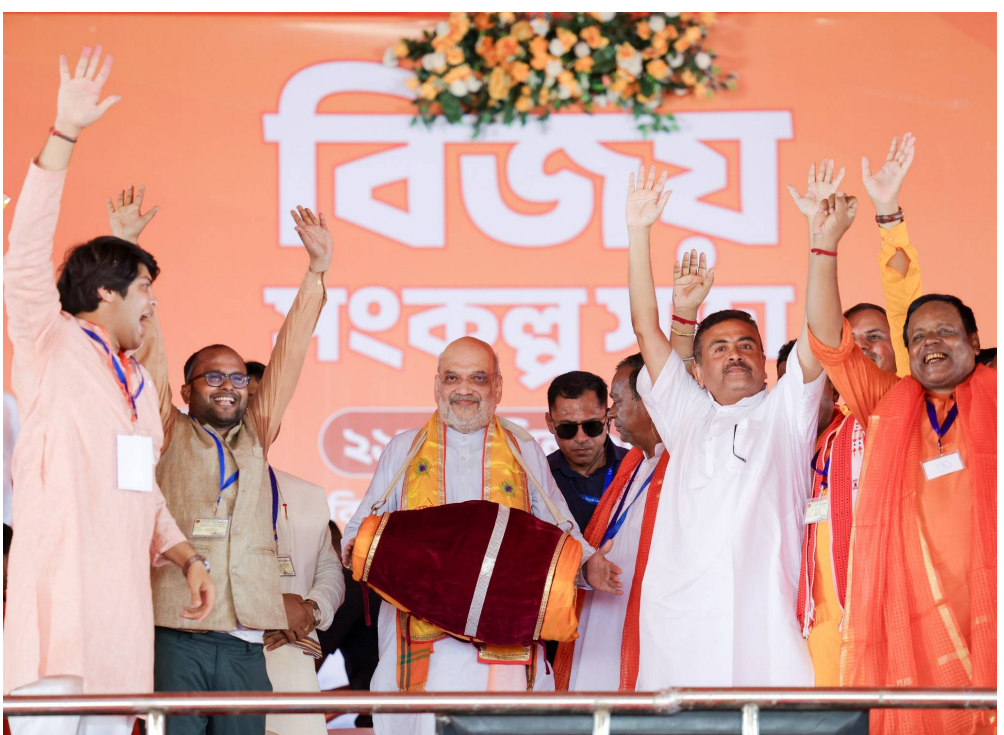
నిష్పక్షపాతంగా పోలింగ్ వక్రియను నిర్వహించారంటూ ఎన్నికల సంఘం, స్థానిక పోలీసులు, భద్రతా దళాలకు ఆయన ధన్యవాదాలు తెలిపారు. చాలా కాలం తర్వాత ఒక్కరి ప్రాణం కూడా పోకుండా జరిగిన బెంగాల్ ఎన్నికలు ఇవేనని కేంద్ర హోంమంత్రి అమిత్ షా పేర్కొన్నారు. కాగా, ఈనెల 23న పశ్చిమ బెంగాల్, తమిళనాడు అసెంబ్లీలకు ఎన్నికలు జరిగాయి. తమిళనాడులో 234 స్థానాలకు ఒకేసారి పోలింగ్ జరగ్గా.. పశ్చిమ బెంగాల్లో మాత్రం తొలి దశలో 152 స్థానాలకు ఎన్నికలు నిర్వహించారు. మిగిలిన 142 స్థానాలకు ఏప్రిల్ 29న పోలింగ్ జరగనుంది. మే 4న ఫలితాలు వెల్లడిస్తారు.