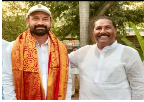
తొలి అక్షరం/నెక్కొండ ఏప్రిల్ 23: వరంగల్ జిల్లా సర్పంచ్ ఎమ్మెల్యే దొంతి మాధవరెడ్డి ఆదేశానుసారం నెక్కొండ బ్లాక్ కాంగ్రెస్ పరిధిలోని నెక్కొండ, చెన్నారావుపేట, ఖానాపూరం మండల కాంగ్రెస్ పార్టీ అధ్యక్షులకు, ముఖ్య నాయకులకు మరియు అన్ని గ్రామాల కాంగ్రెస్ పార్టీ అధ్యక్షులకు, కాంగ్రెస్ పార్టీ సర్పంచ్ లకు తెలియజేయనుంది ఏమనగా మూడు మండలాలలో ఉన్న అన్ని బూతులకు, బూత్ ఇన్చార్జీలను నియమించడం కోసం తగు చర్యలు తీసుకోగలరు. ప్రతి బూత్ కు ఒక ఇన్చార్జీని ఎంపిక చేసి వారి ఫోటో, ఓటర్ ఐడి కార్డు తో ఫోటో నింపి, అతని సంతకాలు చేయించి, అందజేయగలరు. బూత్ లెవెల్ ఏజెంట్ నియామకం మీ గ్రామంలో భూతల ఏజెంట్ బిఎల్ ఓ ను పార్టీ ముఖ్య అధ్యక్షులతో ఎంపిక చేసి మండల కాంగ్రెస్ అధ్యక్షులకు వివరాలు అందజేయగలరు.-అవసరమైన వివరాలు పత్రాలు,1) బూతు లెవెల్ ఏజెంట్ వ్యక్తి యొక్క పాస్పోర్ట్ సైజ్ ఫోటోలు మూడు, 2), ఓటర్ ఐడి జిరాఫ్ట్,3) వ్యక్తి ప్రత్యక్షంగా హాజరై ఫారం పై సంతకం చేయాలి.4)ఫోన్ నెంబరు5)బూతు సంఖ్య 6), వరుస సంఖ్యలు తదితర అంశాలు ఉంటాయి .