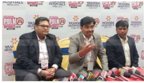
తొలి అక్షరం/హస్తకౌండ ప్రతినిధి: యశోద హైటెక్ సిటీ

యాజమాన్యం ఆధ్వర్యంలో హంటర్ రోడ్ లోని కోడం కన్వెన్షన్ హాల్ లో వరంగల్ జిల్లాలో పనిచేస్తున్నటువంటి వైద్యులకు ఊపిరితిత్తుల అవగాహన సదస్సును ఏర్పాటు చేశారు. ఈ సదస్సులో జిల్లా వ్యాప్తంగా సుమారు 310 మంది యువ