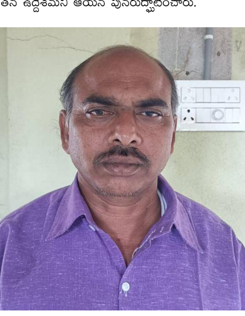
తన ఉద్దేశమని ఆయన పునరుద్ఘాటించారు.