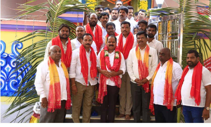
తొలి అక్షరం/షాద్ నగర్, ఏప్రిల్ 20: మొగలిగిద్ద గ్రామంలో ప్రజలందరూ ఆయురారోగ్యాలతో అష్టైశ్వర్యాలతో వర్ధిల్లాలని షాద్ నగర్ ఎమ్మెల్యే రాష్ట్ర ప్రభుత్వ రంగ సంస్థల చైర్మన్ వీరపల్లి శంకర్ అమ్మవారిని కోరారు. ఘరాక్ నగర్ మండలం మొగలిగిద్ద గ్రామంలో కొలువైన శ్రీ బంగారు మైనమ్మ అమ్మవారిని సోమవారం మైనమ్మ బొడ్రాయి పండుగ వేడుకల సందర్భంగా దర్శించుకుని, ప్రత్యేక పూజలు నిర్వహించడం జరిగింది. అమ్మవారికి ప్రత్యేక పూజలు నిర్వహించిన అనంతరం గ్రామ పెద్దలు తదితరులు ఎమ్మెల్యే శంకర్ తదితరులను ఘనంగా సన్మానించారు. అనంతరం ఎమ్మెల్యే మాట్లాడుతూ తెలంగాణ రాష్ట్ర ప్రజలందరూ ఆయురారోగ్యాలతో, అష్టైశ్వర్యాలతో ఎల్లప్పుడూ సుఖిక్షంగా వర్ధిల్లాలని ఆ చల్లని తల్లిని మనస్ఫూర్తిగా వేడుకున్నామని అని ఎమ్మెల్యే మీడియాతో తెలిపారు. కోట మైనమ్మ బొడ్రాయి పండుగ కీ హాజరైన వీరపల్లి శంకర్ అన్న ఈ కార్యక్రమంలో, గుట్ట రాజ్, మొగలిగిద్ద మాజీ ఎంపిటిసి శ్రీశైలం, సురేందర్, విజయ్ కుమార్ గౌడ్, పటాన్ పాషా, డీలర్ మల్లేష్, అమ్మత్ సాగర్, సాయి గౌడ్, బ్యాగరి వెంకటేశ్, రవి కుమార్, బాలకృష్ణ గౌడ్, ఈగ మల్లేష్, రాకేష్, మాలి, అనుమారి వెంకటయ్య, మరి గ్రామస్థులు పాల్గొన్నారు, మార్కెట్ కమిటీ చైర్ పర్సన్ సులోచన కృష్ణారెడ్డి, పిఎసిఎస్ దామోదర్ రెడ్డి, కేకే కృష్ణ, తిరుపతి రెడ్డి, మాధవులు, తుంపల్లి సర్పంచ్ రామ చంద్రయ్య, భాక్ కాంగ్రెస్ ప్రెసిడెంట్ బాలరాజు గౌడ్ పాల్గొన్నారు.