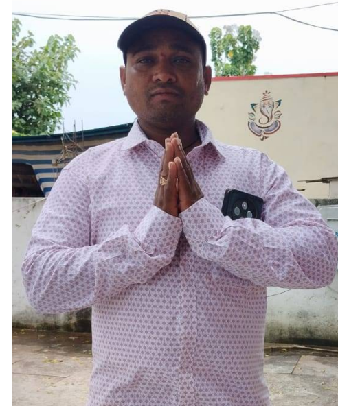
మండల ఓపీసీ విభాగం తరఫున ఆయన ప్రత్యేక ధన్యవాదాలు తెలియజేశారు.

పక్షపాతి అని మరోసారి నిరూపితమైంది. సాగు సమయంలో పెట్టుబడి కోసం రైతులు ఇబ్బంది పడకూడదనే ఉద్దేశంతో, 1 నుండి 5 ఏకరాల లోపు ఉన్న 45.11 లక్షల మంది రైతులకు రూ. 5.653 కోట్లు విడుదల చేయడం గొప్ప విషయం. గత పదేళ్లు గా రైతులను వంచించిన వారికి ఈ నిధుల విడత చెంపపెట్టు లాంటిది” అని వ్యాఖ్యానించారు. పార్లమెంటు పాలన: పైసా లంచం లేకుండా, మధ్యవర్తుల ప్రమేయం లేకుండా నేరుగా రైతుల ఖాతాల్లోకి నగదు జమ కావడం రేవంత్ రెడ్డి మార్క్ పాలనకు నిదర్శనం. రైతు రుణమాఫీ: ఇప్పటికే రుణమాఫీతో రైతులను రుణ విముక్తులను చేసిన ప్రభుత్వం, ఇప్పుడు రైతుభరోసా ద్వారా కొత్త ఉత్సాహాన్ని నింపుతోంది. మండల రైతాంగం తరఫున కృతజ్ఞతలు: ఇసుగుర్తి మండల పరిధిలోని రైతులకు ఈ నిధులు ఎంతో ఆనందంగా నిలుస్తాయని, రైతు సంక్షేమం కోసం ప్రభుత్వం తీసుకుంటున్న ప్రతి నిర్ణయానికి తాము అండగా ఉంటామని హరికృష్ణ గారు స్పష్టం చేశారు. అన్నదాతలకు భరోసా కల్పించిన ముఖ్యమంత్రి రేవంత్ రెడ్డి గారికి, రాష్ట్ర ప్రభుత్వానికి ఇసుగుర్తి